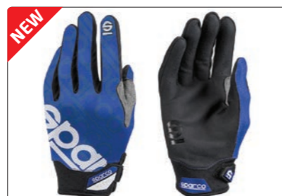
MECA 3 &gt; PAGE 219