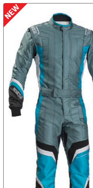
X-LIGHT KS-7 > PAGE 230