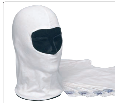
Sottocasco 100% cotone. Balaclava 100% cotton. Forro de 100% algodón.