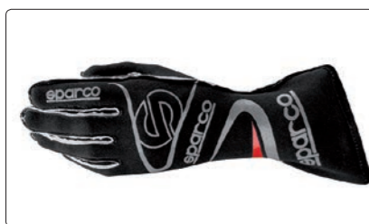
ARROW KG-7 > PAGE 259