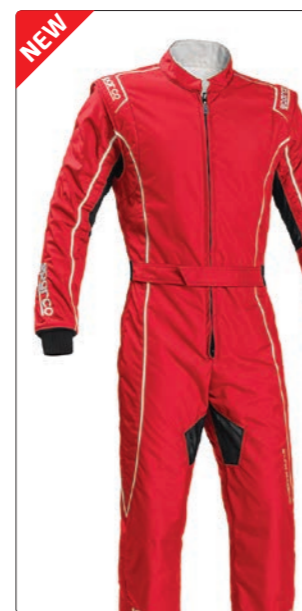
GROOVE KS-3 > PAGE 236