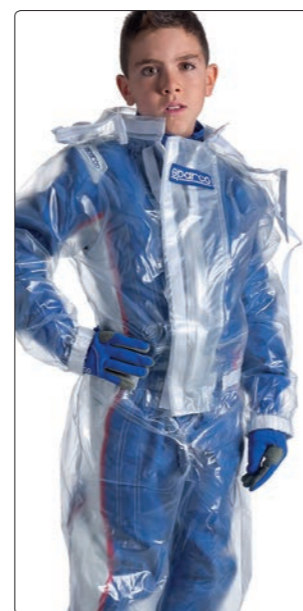
T-1 > PAGE 240