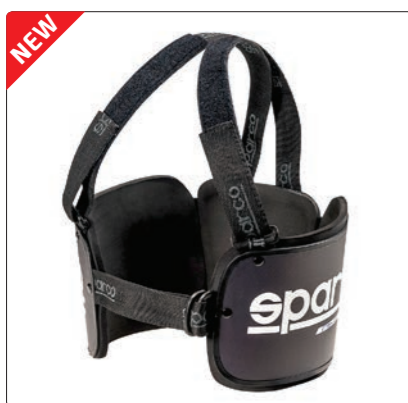
RIB PRO K-5 > PAGE 245