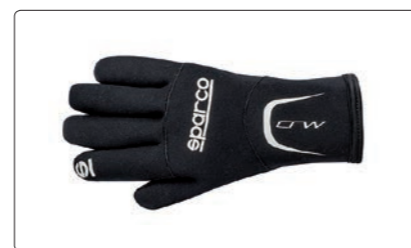
CRW > PAGE 262