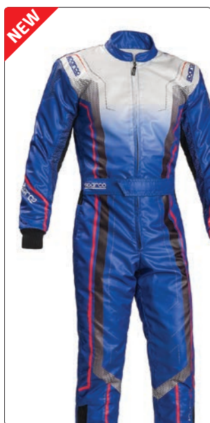
PRIME KS-10 > PAGE 226