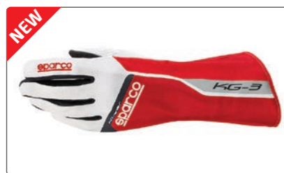
TRACK KG-3 > PAGE 261