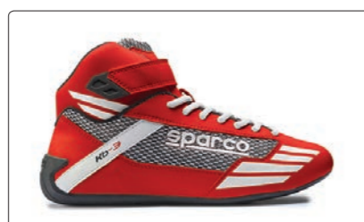
MERCURY > PAGE 256