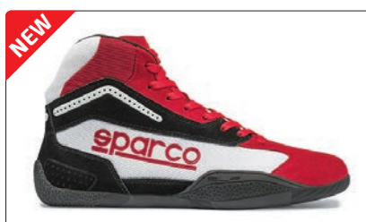
GAMMA KB-4 > PAGE 255