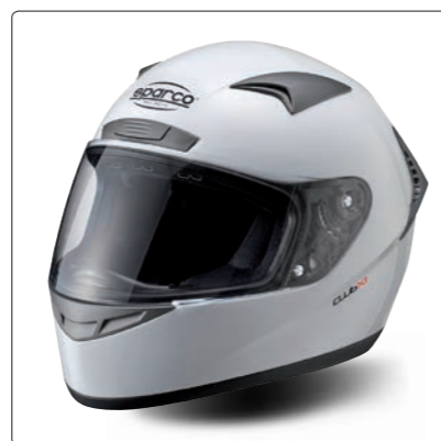
CLUB X-1 &gt; PAGE 99