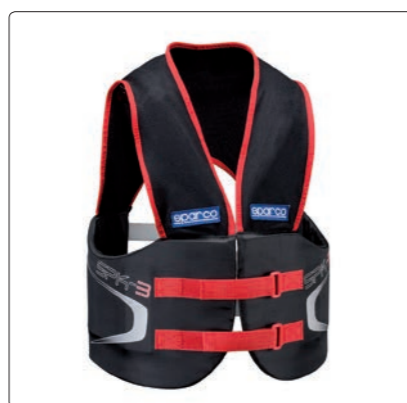
SPK-3 > PAGE 245