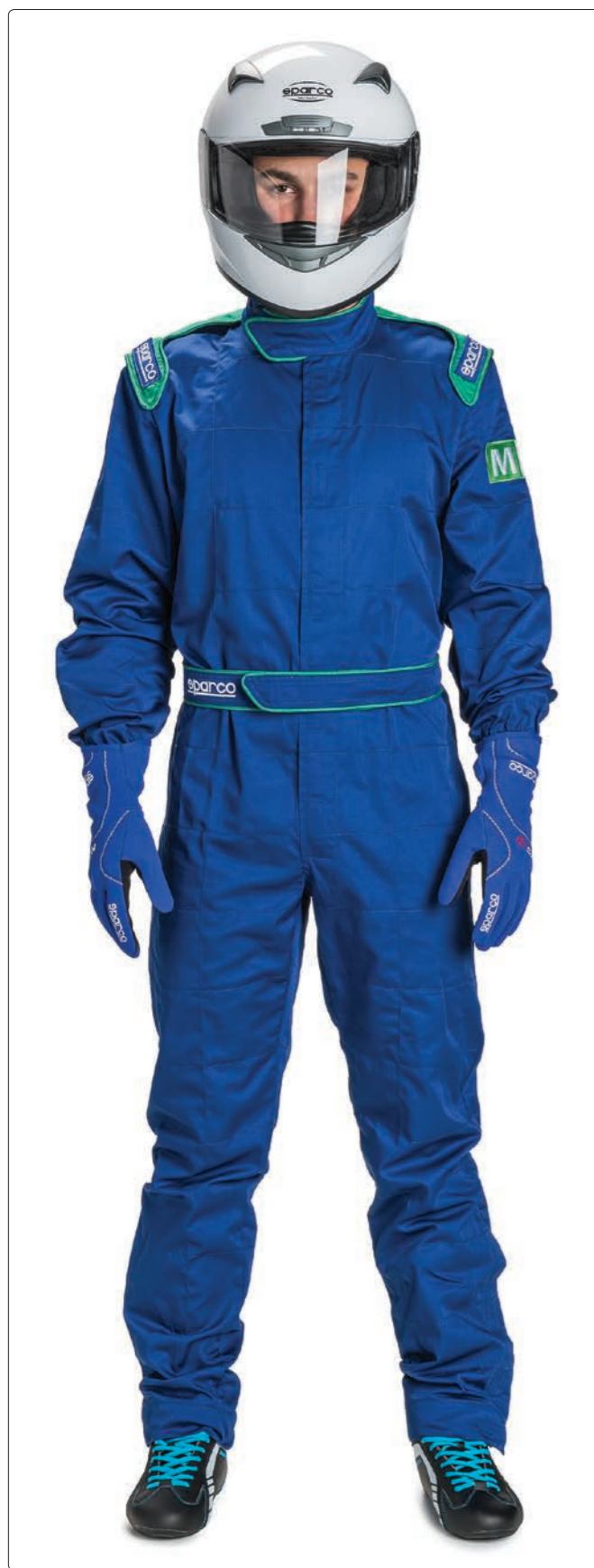
INDOOR K-1 &gt; PAGE 239