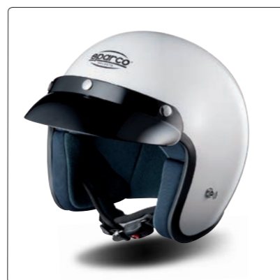
CLUB J-1 &gt; PAGE 106