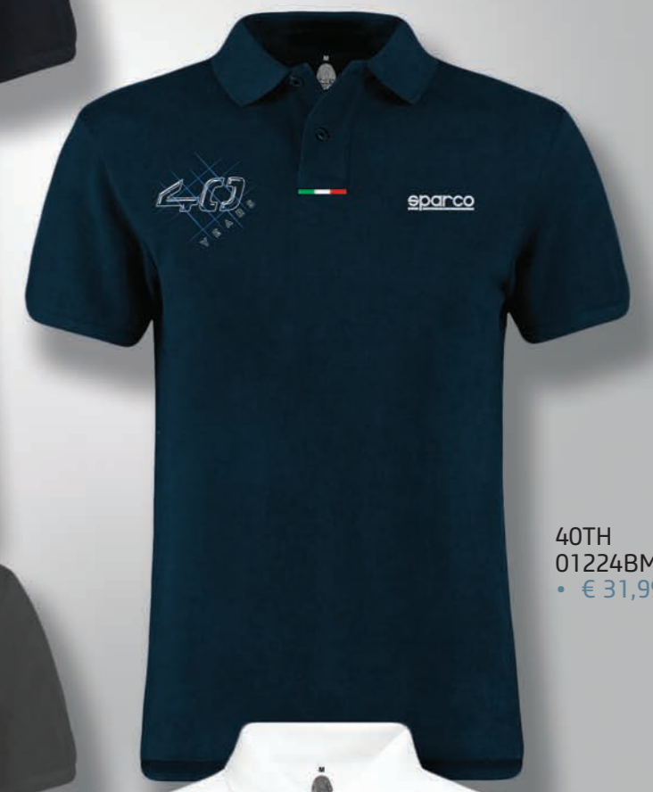
40TH 01224BM... • € 31,99