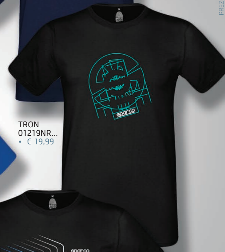
TRON 01219NR... • € 19,99