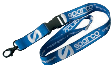
Set da 10 porta Badge - Set of 10 badge Set de 10 chapas