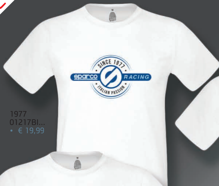
1977 01217BI... • € 19,99