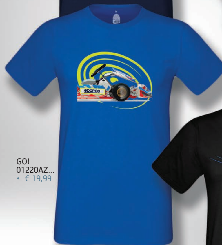
GO! 01220AZ... • € 19,99