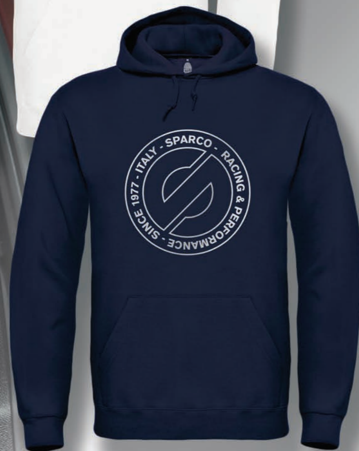
HOODIE PERFORMANCE 01227BM... • € 36,99

COMPOSIZIONE : 80 % COTONE - 20% POLIESTERE - FELPATA - 280 g/m². CARATTERISTICHE: Felpa con cappuccio foderato, cordoncino e pratica tasca marsupio anteriore. Spalle e giromanica con impuntura piatta. Stampa floccata.