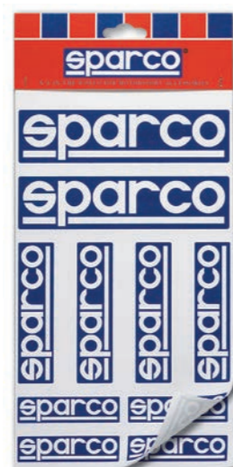
KIT 20 ADESIVI FUSTELLATI KIT OF 20 STICKERS KIT DE 20 ADHESIVOS

4 pcs 15 cm + 8 pcs 10 cm + 8 pcs 7.2 cm