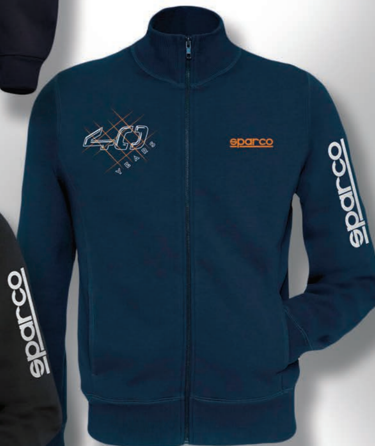
FULL ZIP 40TH 01228BM... • € 64,99

COMPOSICIÓN: 80 % ALGODÓN PEINADO - 20% POLIÉSTER - AFELPADO - 280 g/m². CARACTERÍSTICAS: Sudadera moderna con cremallera entera y cuello alto acanalado. 2 bolsillos laterales con costuras reforzadas. Gráficas con preciadados bordados, patch y estampados.