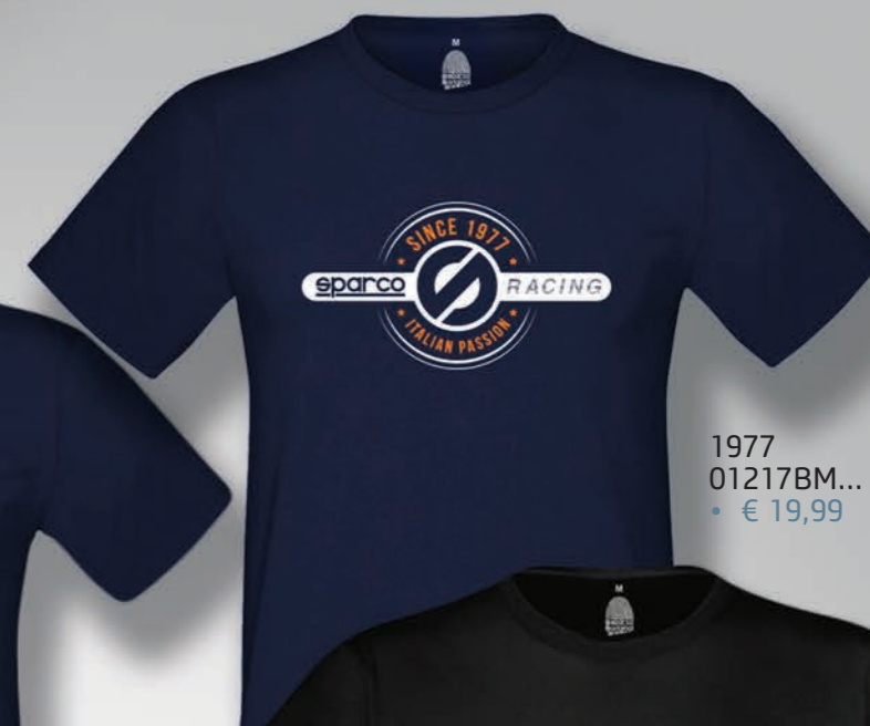
1977 01217BM... • € 19,99