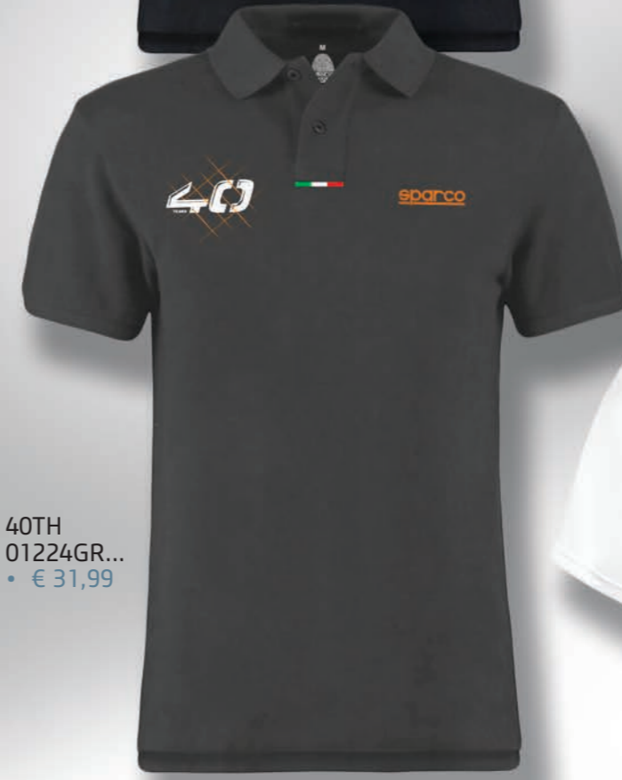
40TH 01224GR... • € 31,99