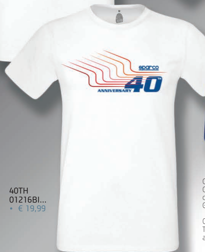
40TH 01216BI... • € 19,99

COMPOSIZIONE : 100% COTONE - 160 g/m 2 . CARATTERISTI- CHE: t-shirt in tessuto morbido e traspirante. Collo con costina in cotone/Lycra e fettuccia interna sulle spalle. Grafiche in stampa digitale soft.