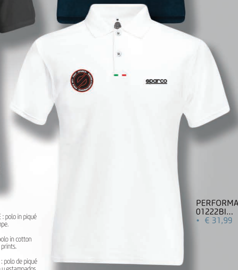
PERFORMANCE 01222BI... • € 31,99

COMPOSIZIONE : 100 % COTONE PIQUE' - 180 g/m². CARATTERISTICHE : polo in piqué con collo piatto a costina, grafiche con pregiati ricami, patch e stampe.