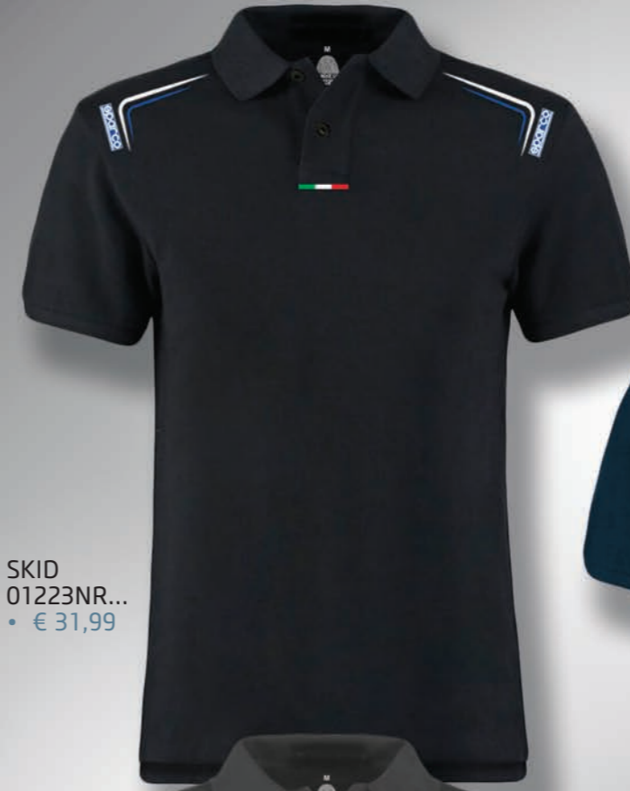
SKID 01223NR... • € 31,99