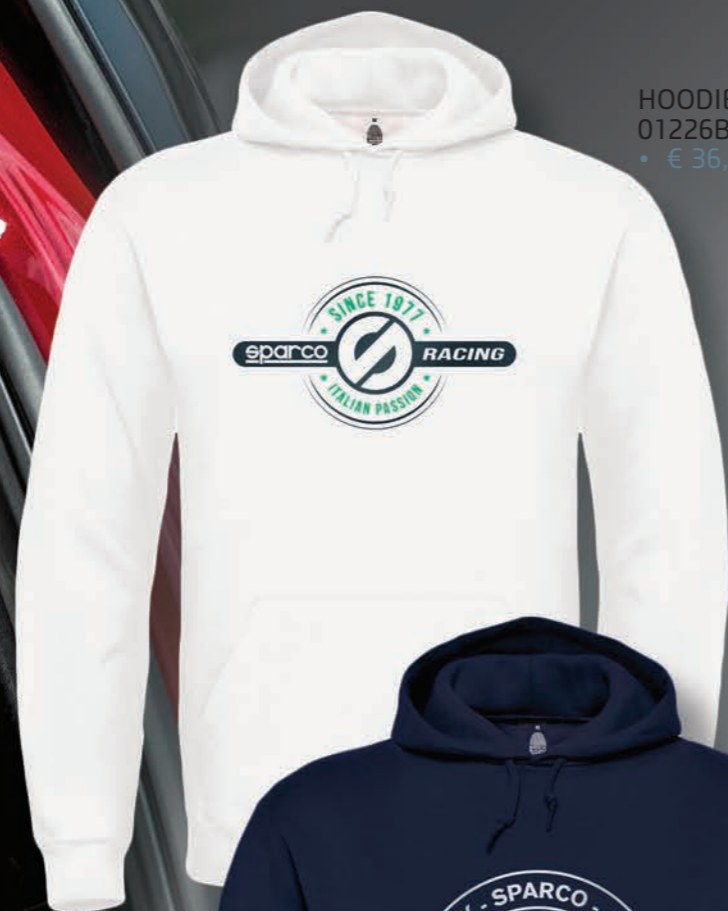
HOODIE 1977 01226BI... • € 36,99