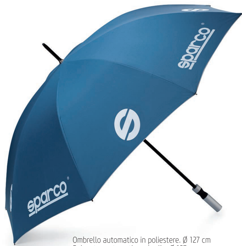
Ombrello automatico in poliestere. Ø 127 cm Polyester automatic umbrella. Ø 127 cm Paraguas automático en poliéster. Ø 127 cm.