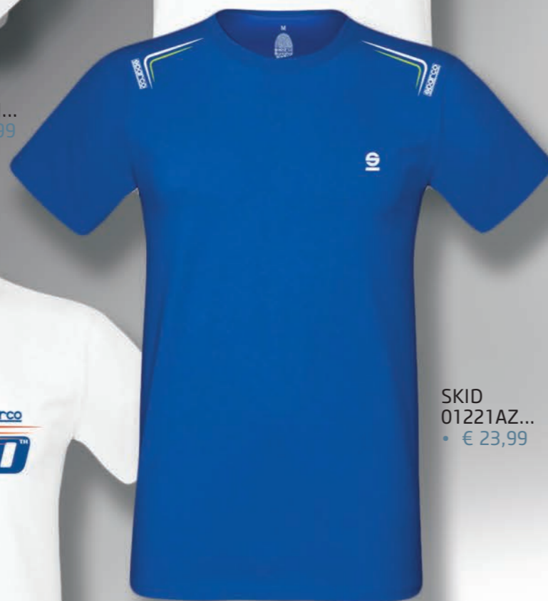
SKID 01221AZ... • € 23,99