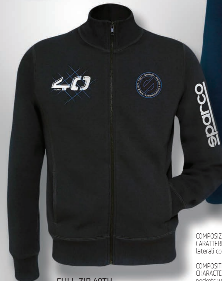
FULL ZIP 40TH 01228NR... • € 64,99

COMPOSIZIONE : 80 % COTONE PETTINATO - 20% POLIESTERE - FELPATA - 280 g/m². CARATTERISTICHE : Moderna felpa con cerniera intera e collo alto a costina. 2 tasche laterali con cuciture rinforzate. Pregiati ricami, patch e stampe.