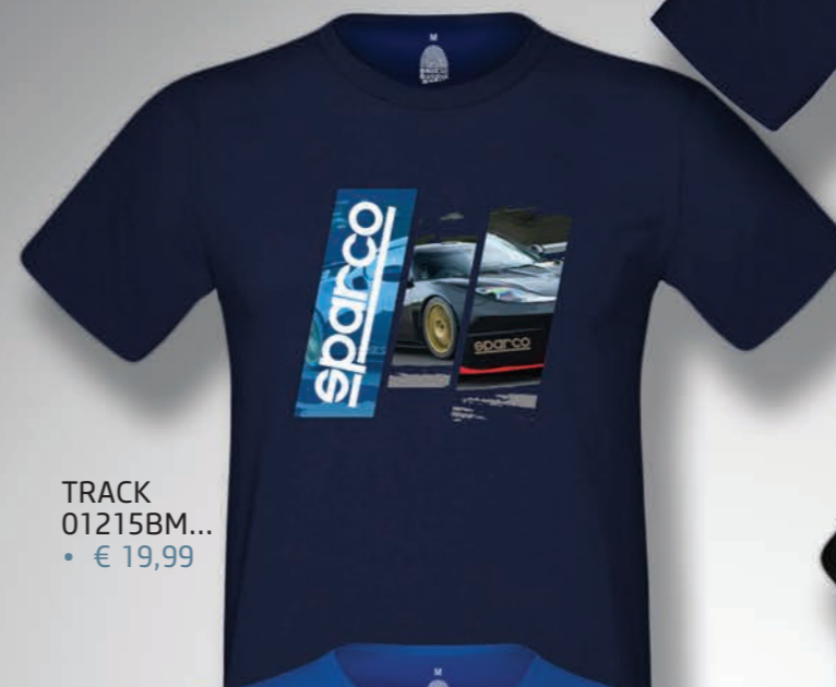
TRACK 01215BM... • € 19,99