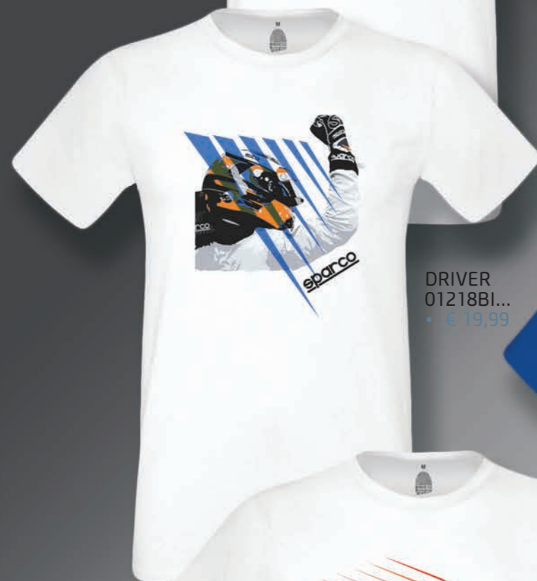
DRIVER 01218BI... • € 19,99