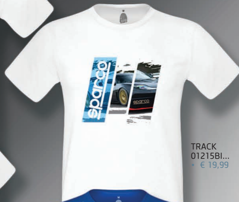
TRACK 01215BI... • € 19,99