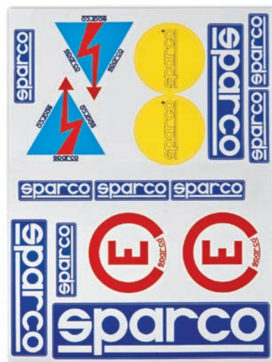
KIT 16 ADESIVI FUSTELLATI KIT OF 16 STICKERS KIT DE 16 ADHESIVOS

Foglio adesivo fustellato da rally Punched sticker rally paper Hoja adhesiva troquelada de rally