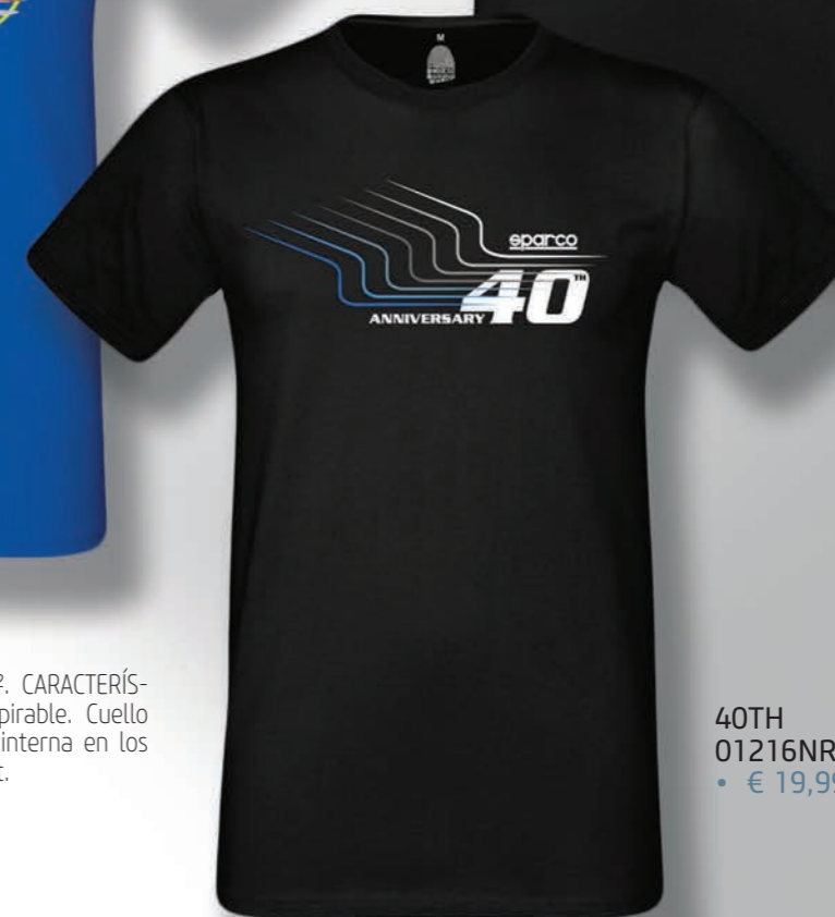
40TH 01216NR... • € 19,99